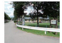
入口の門付近(現在地より約2km)